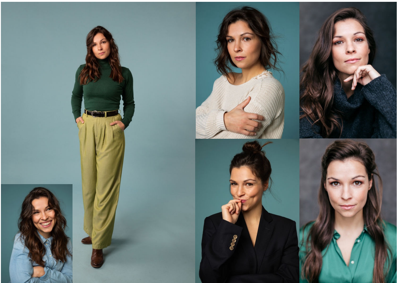
© Isabeau Bosscher / Natalie Hennis